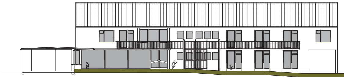
HOF - ANSICHT (Süd-West)